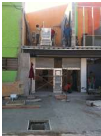
Cuarto de máquinas reducido