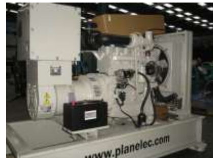
Detalle de componentes