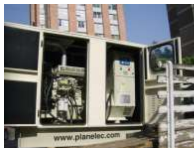
Equipo SuperCompacto abierto