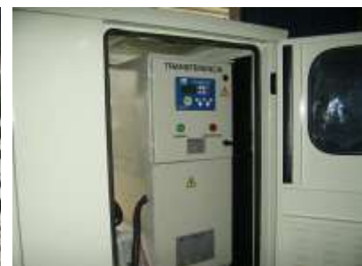
Detalle de Transferencia