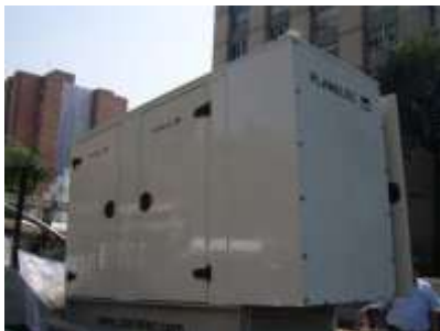
Equipo SuperCompacto cerrado