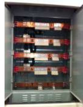
Tablero de Interconexión