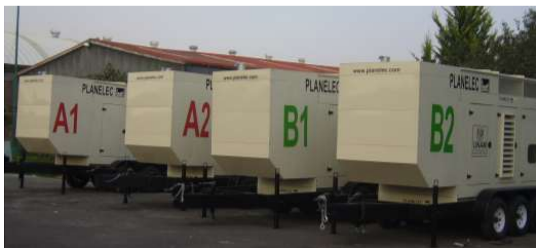
Plantas diesel eléctricas de 500 KW