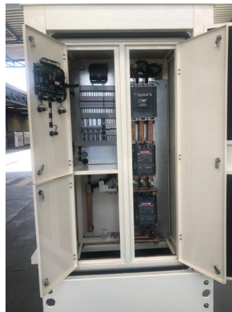
Detalle de transferencia integrada