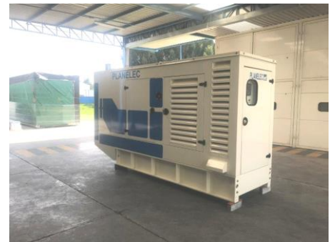
Aspecto exterior con