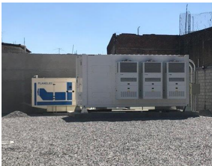
Vista general se la instalación