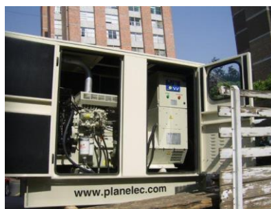
Equipo SuperCompacto Abierto