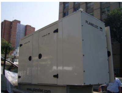
Equipo SuperCompacto Cerrado