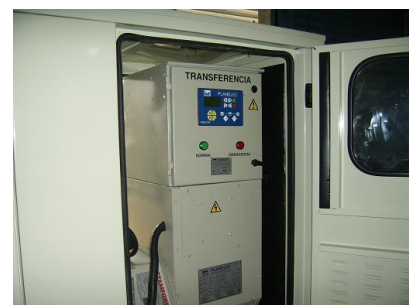
Detalle de Transferencia