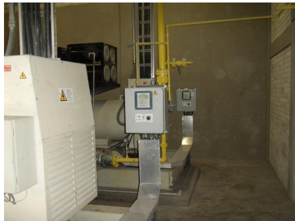
Aspecto de los controles de protección y mezcla