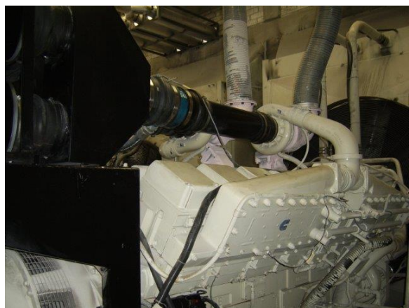
Mezclador de gas en admisión de turbocompresor