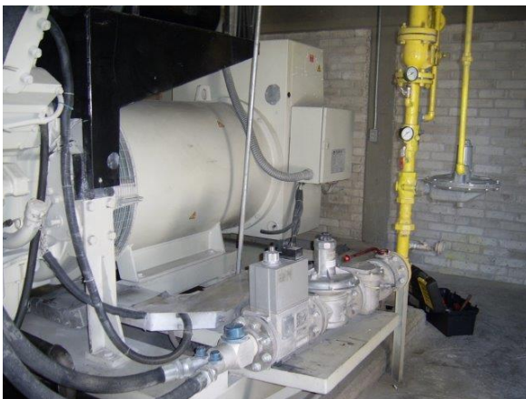
Aspecto del tren de gas y alimentación

Por el gran peso y espacio requerido se opto por una caja seca de tractocamión y se instalado todo el equipo dándole versatilidad para la conexión y desconexión sencilla qua que se tendría que hacer.