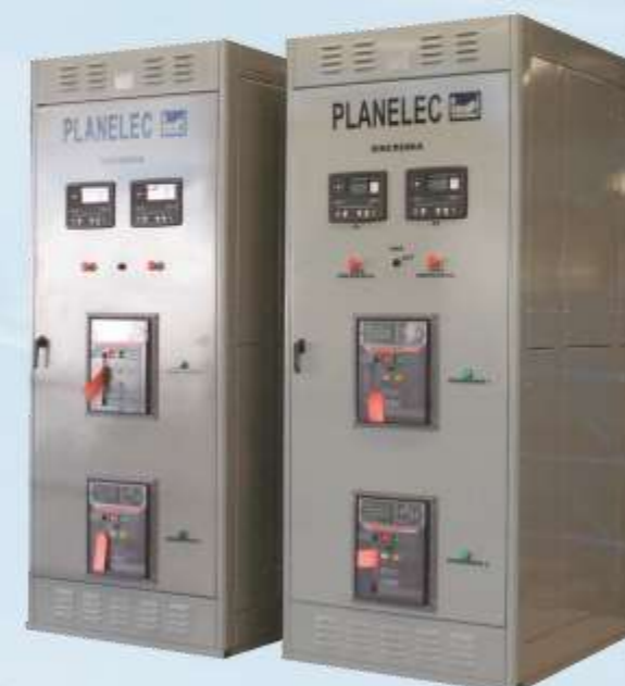
Sistemas de transferencia con sincronización y transición cerrada