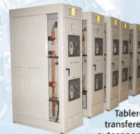
Tablero de transferencia autosoportado