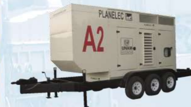
Casetta con remolque