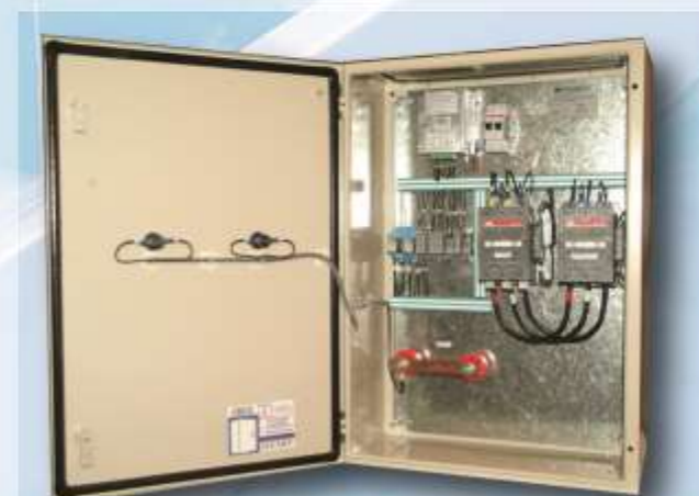
Tablero de transferencia montaje de pared